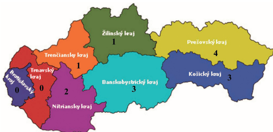
Mapa 1. Počty regionálnych múzeí s oprávnením vykonávať archeologický výskum v jednotlivých krajoch SR

Mape 1. List of museums with an archaeologist authorised to conduct archaeological research projects, for the various regions of Slovakia