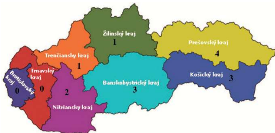
Mapa 1. Počty regionálnych múzeí s oprávnením vykonávať archeologický výskum v jednotlivých krajoch SR

Mape 1. List of museums with an archaeologist authorised to conduct archaeological research projects, for the various regions of Slovakia